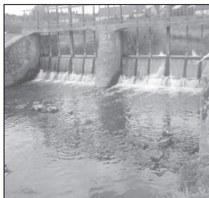
Fotografia 2. Jaz na rzece Oławie km 60+618 (fot. Bartosz Jawecki)

Natomiast w samym powiecie strzelińskim przewiduje się budowę suchego zbiornika przeciwpowodziowego Nieszkowice. W ramach opracowania: „Regionalnego programu budowy małych zbiorników wodnych w dorzeczu Górnej i Środkowej Odry” wykonano Studium techniczno-ekonomiczne, gdzie przedstawiono szczegółowe koncepcje zbiorników wodnych [Regionalny program budowy małych zbiorników wodnych w dorzeczu górnej i środkowej Odry 1997, Drabiński i inni 2006]. Spośród terenów wytypowanych pod budowę zbiorników na terenie powiatu strzelińskiego znalazły się: Maleszów, Przeworno.