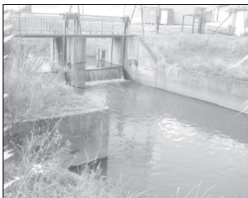
Fotografia 1. Jaz na rzece Oławie km 61+614

Zabudowa zbiornikowa w gminie Strzelin jest ukierunkowana głównie na ochronę przeciwpowodziową. Większość istniejących zbiorników jest jedno-funkcyjna. Aglomeracja miasta Strzelin obejmuje obszar, w którym rozbudowana jest głównie retencja korytowa na rzece Oława. Potencjalne możliwości retencjonowania wody znajdują się w Cegielni Strzelin. W mieście nie przewiduje się budowy nowych obiektów i urządzeń służących retencjonowaniu wód powierzchniowych. Przyjęte kierunki rozwiązań w zakresie zarządzania zasobami wodnymi obejmują racjonalne i oszczędne gospodarowanie wodą, modernizację istniejących obiektów (fot. 1, fot. 2) jak również aktywizację terenów wokół obiektów wodnych na cele turystyczno-rekreacyjne.