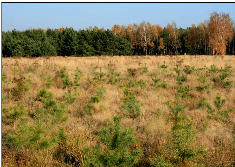
Fotografia 1. Zalesiony teren popoligonowy Bydgoszcz-Jachcice jesienią 2009 r.

Opis doświadczenia. Badania przeprowadzono w roku 2009 na terenie byłego poligonu wojskowego w Bydgoszczy-Jachcicach (Leśnictwo Jagodowo, Nadleśnictwo Żołędowo), w uprawach sosny zwyczajnej ( Pinus sylvestris L) założonych wiosną 2008 r. na potencjalnym siedlisku boru świeżego (fot. 1).