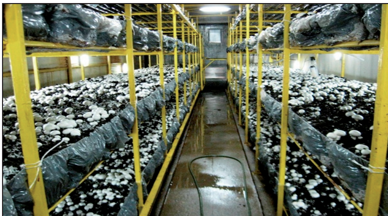
Rysunek 2. Hala uprawowa Figure 2. Cultivation hall