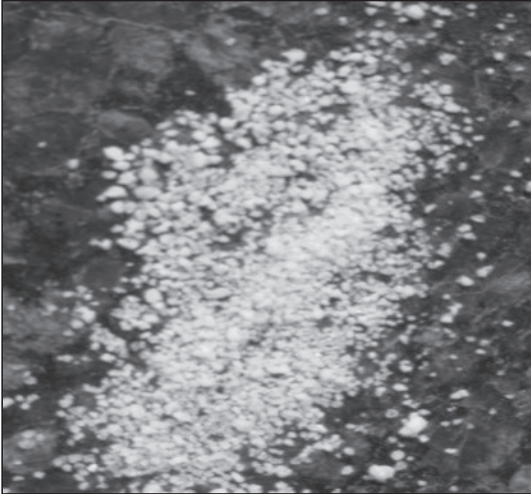
Rysunek 1. Granulat AgroHydroGel służący do mieszania z podłożem Figure 1. Granulate AgroHydroGel used to mixing with substratum

Celem badań niniejszego opracowania było przedstawienie wpływu AgroHydroGelu na wysokość i jakość plonu pieczarek uprawianych w warunkach sterowanego mikroklimatu.