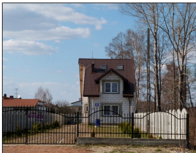
Rysunek 2. „Luka” w zabudowie Figure 2. Housing „gap”