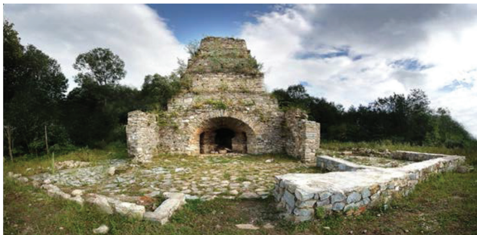
Rysunek 1. „Anheluwska domnycia” – zabytek kultury rzemieślniczej XIX w. (fot. autorki, lipiec 2012)