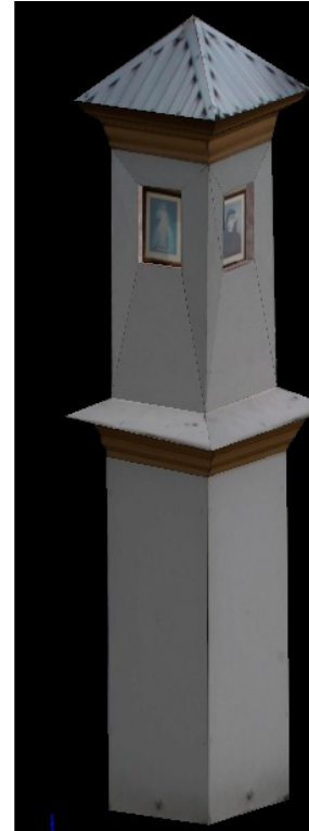
Figure 2. Full vector model of the shrine