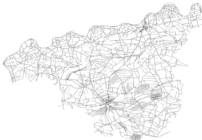
Rysunek 1. Mapa sieci dróg transportu rolnego na terenie powiatu dąbrowskiego Figure 1. The map of agricultural transport road network in the Dąbrowski administrative district.

Przeprowadzona analiza dla wszystkich obrębów powiatu dąbrowskiego pozwoliła na przedstawienie zidentyfikowanego zbioru elementów sieci drogowej (rycina 1), oraz obszarów (działek), nie posiadających dostępu do zdefiniowanej wcześniej sieci drogowej (dane zawężone do działek z podgrup rejestrowych 7.1 oraz 7.2), (rycina 2).