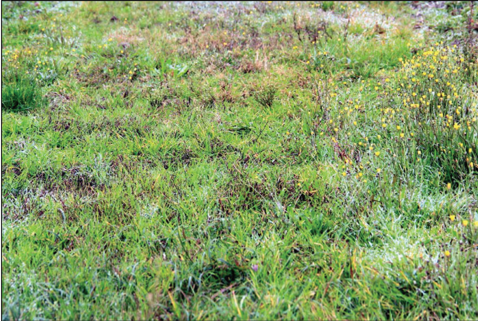
Fotografia 2. Płat murawy (M) w pobliżu uprawy truskawki w Sadzie Doświadczalnym Instytutu Ogrodnictwa w Skierniewicach Photo 2. Patch of grass (M – the control plot) near strawberry cultivation on the experimental orchard of the Institute of Horticulture in Skierniewice

Próbki do badań akarologicznych pobierano wiosną, latem i jesienią 6-krotnie w kolejnych terminach: 27.05.2011, 19.07.2011, 20.10.2011, 27.04.2012, 06.07.2012, 23.10.2012 r. Próbki gleby o wymiarach 17 \text{ cm}^2 \times 3 \text{ cm} głębokości pobierano z obydwu powierzchni w 10 powtórzeniach. Ogółem pobrano 120 próbek gleby. Roztocze wypłaszano przez 7 dni w aparatach Tullgrena, a następnie konserwowano i preparowano. Do gatunku lub rodzaju oznaczono mechowce, łącznie ze stadiami młodocianymi. Pozostałe roztocze oznaczono do rzędów. Przedmiotem analizy było 4597 Acari , w tym 3484 Oribatida . Średnie zagęszczenie ( N ) roztoczy podano w przeliczeniu na 1 \text{ m}^2 gleby, wskaźnik dominacji D w %, a różnorodność gatunkową mechowców wyrażono za pomocą liczby gatunków ( S ) i średniej liczby gatunków w próbce ( s ). Obliczenia statystyczne przeprowadzono za pomocą programu Statistica 6 – istotność różnic weryfikowano stosując analizę wariancji (Anova, test post-hoc NIR Fishera).