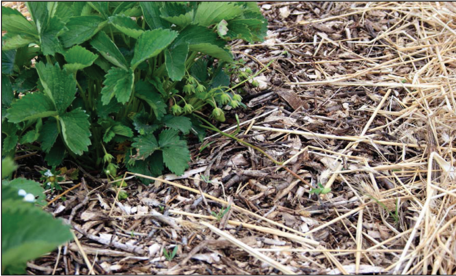
Fotografia 1. Ściółkowana zrębkami plantacja truskawki (powierzchnia Z), Sad Doświadczalny Instytutu Ogrodnictwa w Skierniewicach

ki zostały przygotowane z gałęzi przydrożnych drzew i krzewów liściastych za pomocą rębaka tarczowego jesienią 2010 r., zimę przeleżały w warunkach terenowych na przyzmach w miejscu ich wyprodukowania. Na początku marca 2011 r. zostały przeniesione w workach do szklarni, gdzie po 2 tygodniach wysypano je do skrzyń i zroszono wodą. W międzyrzędziach truskawki zrębki rozsypano 6 maja, warstwą o miąższości ok. 5 cm. Kwasowość tak przygotowanej ściółki wynosiła 6,4 (pH w H 2 O), a C/N = 38.