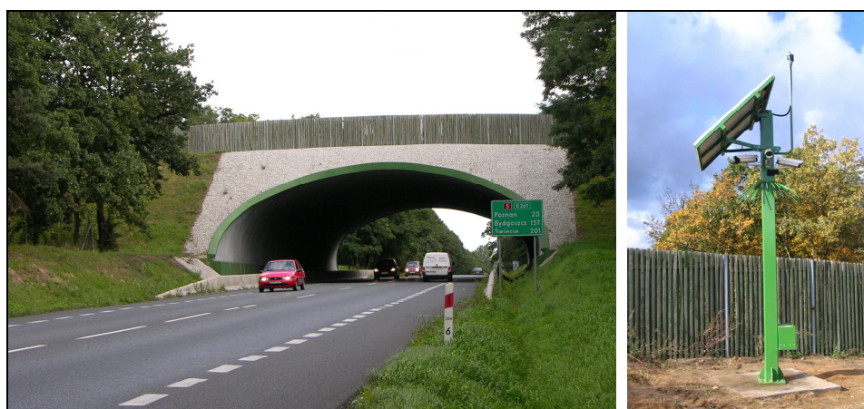
Fotografia 1. Przejście dla zwierząt nad drogą krajową nr 5 oraz zestaw obserwacyjny wraz z układem zasilającym

W skład zestawu obserwacyjnego wchodzi: kamera w hermetycznej, podgrzewanej obudowie, radiowy nadajnik sygnału wizyjnego, oświetlacz podczerwieni z wyłącznikiem zmierzchowym oraz zespół urządzeń zasilających – baterie ogniwo fotowoltaicznych, regulator napięcia, baterie akumulatorów. Pobór mocy całego zestawu w zależności od pory dnia i roku zmienia się w granicach od 10 W do 45 W. Urządzenia zestawu obserwacyjnego zaprojektowano do bezobsługowej pracy przez 24 godziny na dobę.