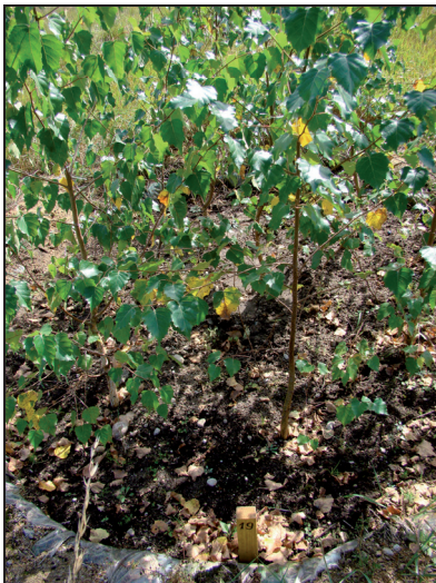
Fotografia 1. Widok na kołowe powierzchnie doświadczalne