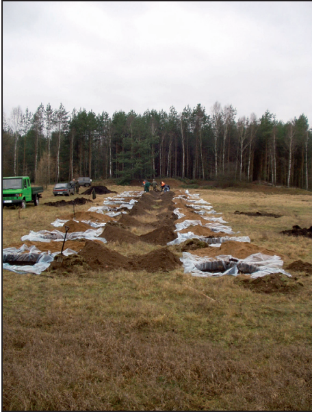
Fotografia 1. Widok na kołowe powierzchnie doświadczalne