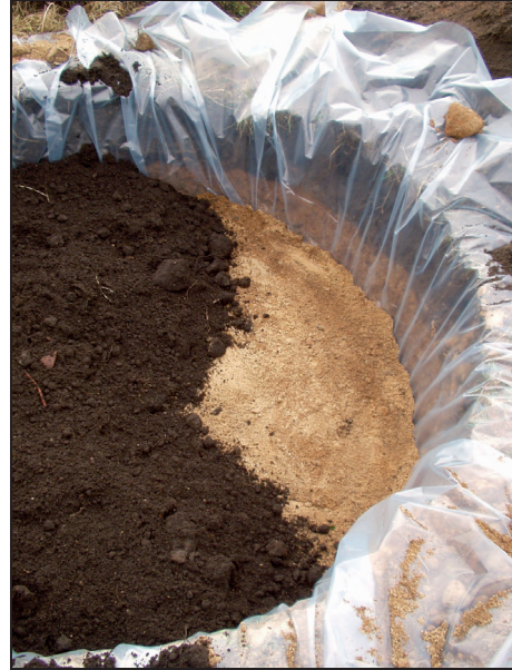
Fotografia 2. Wyizolowana geomembraną gleba w kołowej powierzchni doświadczalnej