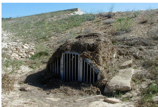
Fotografia 5. zbiornik Terrain de l'Armée ; krata chroniąca wlot w kształcie tunelu Photo 5. Terrain de l'Armée Reservoir: grate protecting inlet of the tunnel

Opady z września 2005 r. wykazały, że zachowanie się zlewni silnie zależy od początkowej wilgotności gleby, a zwłaszcza od stanu wypełnienia krasu. W związku z tym trudno oceniać skuteczność budowli, biorąc pod uwagę tylko intensywność opadów. Ogólna ocena jest utrudniona z powodu małej wielkości zlewni i dużego zróżnicowania przestrzennego rozkładu opadów.