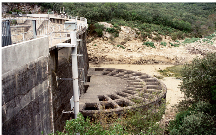
Fotografia 4. Zapora la Rouvière: zapora wstępna stwarzająca stały zbiornik oraz kraty betonowe

Analizując rozwiązania techniczne, można stwierdzić, że przy dużych przepływach istnieje konieczność stosowania dużych, mocnych krat celem uniknięcia zablokowania otworów spustowych. Chociaż wszystkie zapory są sterowalne.