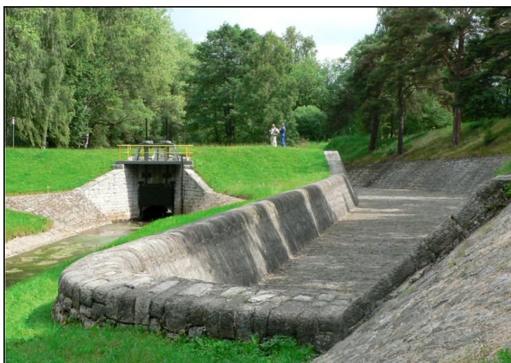
Fotografia 2. Widok zapory Krzeszów od strony wody dolnej; upust denny i przelew boczny

Photo 1. Sobieszowice Dam: downstream, with the basin made of concrete with stones