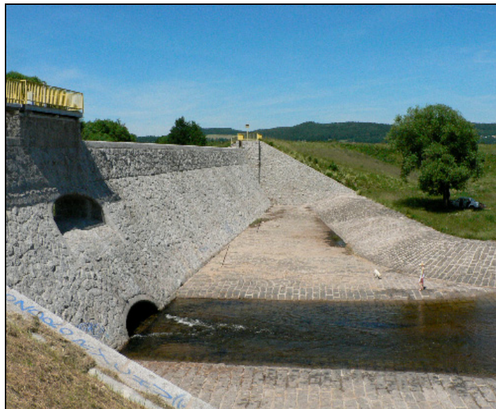
Fotografia 1. Zapora w Sobieszowie od strony wody dolnej, część centralna z okładziną kamienną i niecka wypadowa

Photo 1. Sobieszowice Dam: downstream, with the basin made of concrete with stones