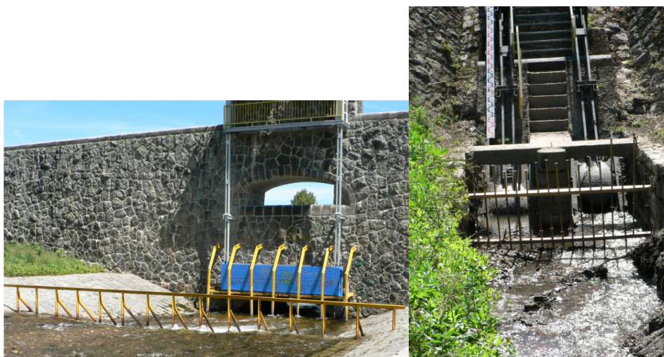
Fotografia 3. Dwa przykłady upustów w zapórach suchych zbiorników w Sudetach (a) Sobieszów, widok od strony wody górnej, upust denny zabezpieczony kratą i przelew awaryjny (b) Bolków, widok od strony wody górnej, wejście do upustu zabezpieczone kratą

W Sobieszowie (fot. 3a), dwie kraty są umieszczone jedna za drugą. Krata przy zaporze chroni upust przed dostaniem się obiektów pływających górą, np. przy opadaniu wód. W Bolkowie (fot. 3b) istnieje jedna niska krata blisko upustu. Inne zapory, jak na przykład Krzeszów nie mają krat.