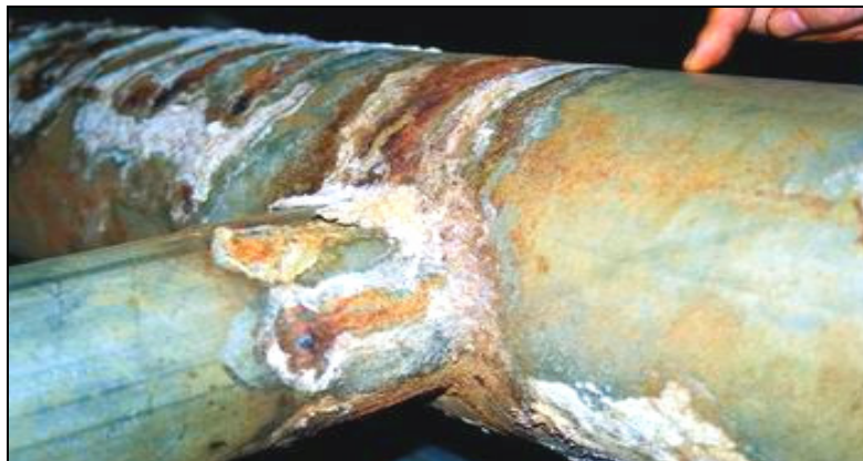
Rysunek 2. Korozja rur systemu ciepłowniczego w Pырzycach Figure 2. Pipes corrosion of heating system in Pырzyce