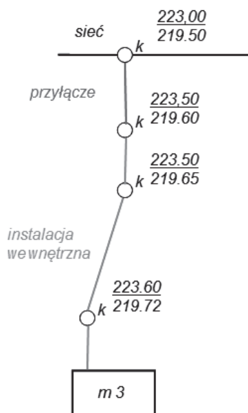
Rysunek 2. Przyłącze kanalizacyjne zgodnie z definicją Figure 2. The sewer lateral as defined