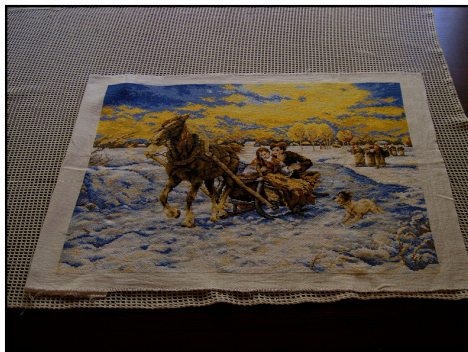
Rysunek 6. Obraz wykonany haftem krzyżykowym Figure 6. Picture made cross stitch