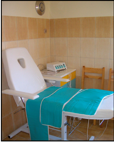
Rysunek 2. Gabinet kosmetyczny Figure 2. Beauty salon