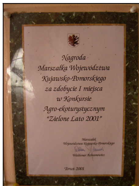
Rysunek 9. Nagroda otrzymana przez właścicielkę gospodarstwa Figure 9. The award received by the owner of the farm