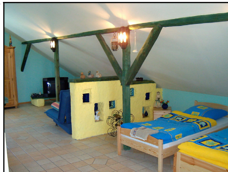
Rysunek 7. Pokój gościnny Figure 7. Guest room