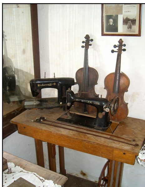
Rysunek 8. Ekspozyty ze skansenu założonego przez właścicielkę gospodarstwa Figure 8. The exhibits of the museum founded by the owner of the farm