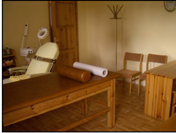
Rysunek 3. Gabinet masażu leczniczego Figure 3. Therapeutic massage salon