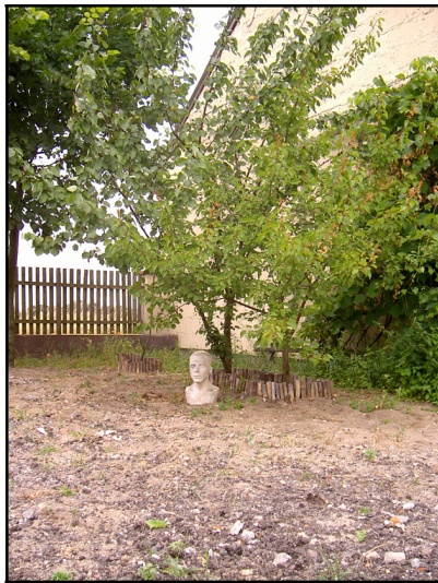
Rysunek 4. Ekspozycja z warsztatów rzeźbiarskich Figure 5. An exhibit of sculpture workshops