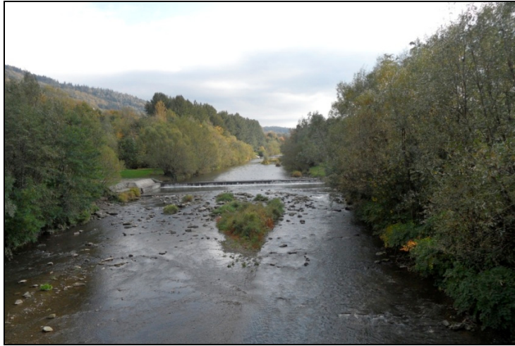
Fotografia 2. Wisła, w dolinie której zbudowano miasteczko Ustroń – widok na rzekę z mostu przy ul. M. Grażyńskiego - Szpitalnej (fot. autorki, październik 2012 r.)