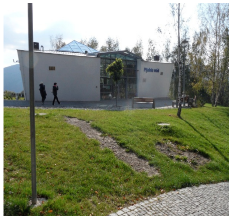
Fotografia 8. Budynek pijalni wód leczniczych oddany do użytku w czerwcu 2012 roku (październik 2012)

Photo 7. Fountain in close vicinity to the curative water well-room (October 2012)