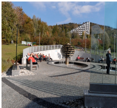
Fotografia 7. Fontanna w bezpośrednim sąsiedztwie Pijalni wód leczniczych (październik 2012)

Photo 6. The interior of the well-room (October 2012)