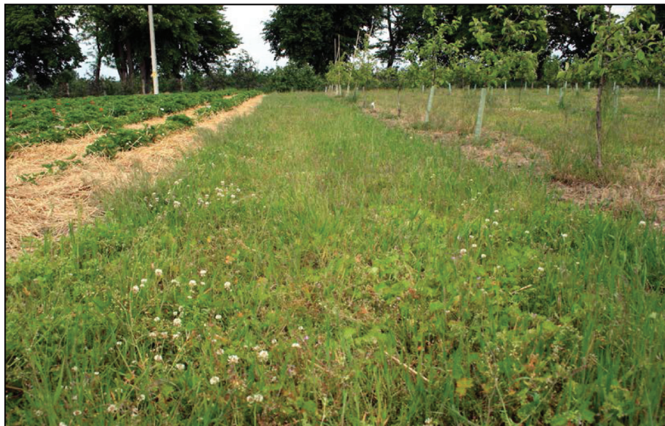
Fotografia 2. Płat murawy (M – powierzchnia kontrolna) w pobliżu uprawy truskawki na polu doświadczalnym Instytutu Ogrodnictwa w Skierniewicach

potraktowano czystą wodą w tej samej ilości). W międzyrzędziach truskawki zrębki rozsypano 6 maja, warstwą o miąższości ok. 5 cm. Kwasowość tak przygotowanej ściółki wynosiła 6,4-6,6 (pH w H 2 O), a C/N = 36-42.