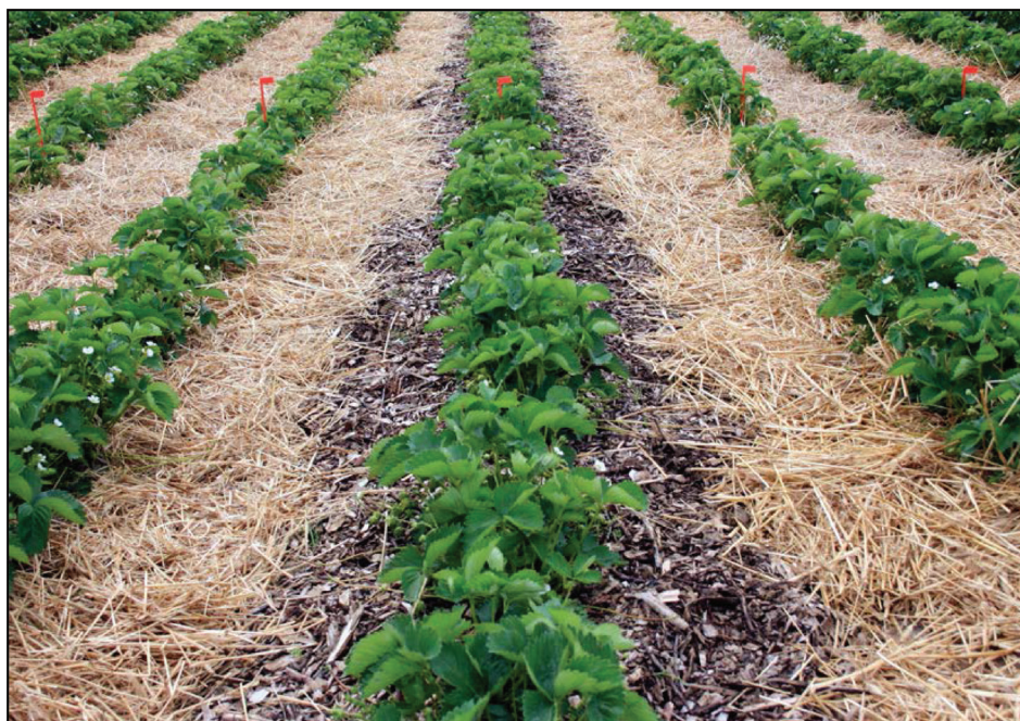
Fotografia 1. Ściółkowana zrębkami uprawa truskawki w Sadzie Doświadczalnym Instytutu Ogrodnictwa w Skierniewicach

Photo 1. Mulched wood chips cultivation of strawberries. Field studies were conducted on the experimental field of the Institute of Horticulture in Skierniewice