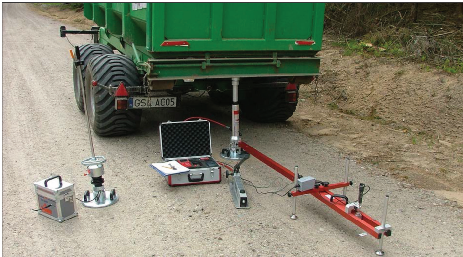
Rysunek 1. Lekka płyta dynamiczna – po lewej i płyta statyczna – po prawej stronie

Zdolność nawierzchni do przyjmowania obciążeń od kół pojazdów może być również określana poprzez pomiary wartości sprężystych ugięć nawierzchni ( U_s ) ugięciomierzem belkowym Benkelmana wg BN-70/8931-06. Wyniki tego rodzaju badań dla dróg leśnych podaje Trzcíński (2011).